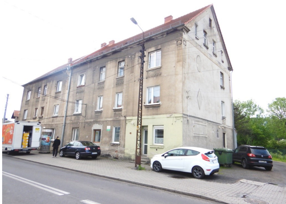
Ogólny widok budynku

na sprzedaż lokalu mieszkalnego Nr 7 znajdującego się w budynku położonym w Lubaniu przy ul. Leśnej 38A wraz z udziałem we współwłasności nieruchomości gruntowej (działka nr 85, AM 16, Obręb V o powierzchni 190 m 2 , JG1L/00015987/0)